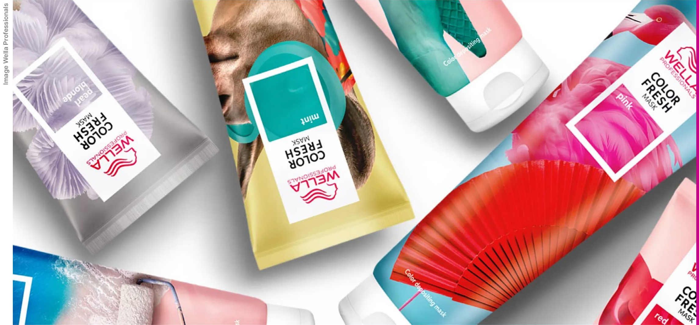
Image Wella Professionals

_ design of illustrations PACKAGING SHADES